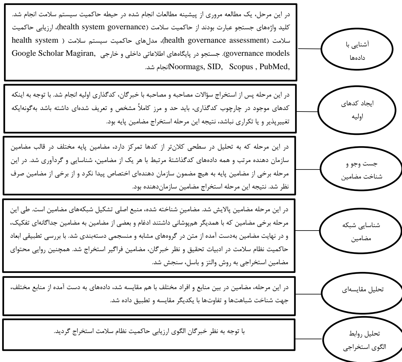
شکل ۱: مراحل انجام پژوهش

به منظور تامین هدف پژوهش، داده‌ها با روش اسنادی و مصاحبه عمیق با خبرگان وزارت بهداشت، درمان و آموزش پزشکی جمع‌آوری شد. زمان و مکان انجام مصاحبه‌ها با توجه به خبرگان و هماهنگی‌های قبلی با ایشان تعیین شد. پس از هماهنگی‌های اولیه، سؤالات مصاحبه و پروپوزال تحقیق با مراجعه حضوری یا ارسال از طریق دورنما یا پست الکترونیکی در اختیار خبرگان قرار گرفت. این امر به آماده‌سازی ایشان برای شرکت در مصاحبه کمک کرد. علاوه بر این فرم، در ابتدای مصاحبه، مصاحبه‌گر توضیحاتی شفاهی درباره مطالعه و اهداف آن و تمهیدات محرمانه ماندن اطلاعات ارائه داد؛ سپس،