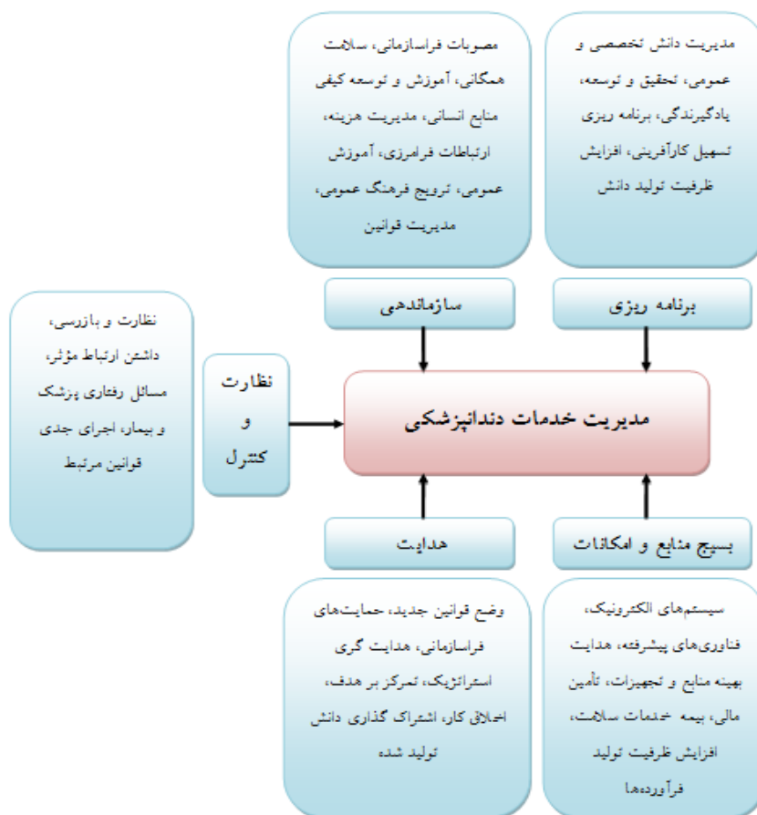
شکل ۲: مدل پیشنهادی مدیریت خدمات دندانپزشکی

سطح خطای متداول و استاندارد جهت بررسی روابط ۰/۰۵ و سطح اطمینان ۰/۹۵ بود. تحلیل داده‌ها نشان داد که متغیرهای برنامه ریزی، سازماندهی، بسیج منابع و امکانات، هدایت و نظارت و کنترل با ضرایب تأثیر ۰/۱۷۳، ۰/۷۰۴، ۰/۱۹۳، ۰/۰۳۴ و ۰/۲۷۳ در سطح معنی داری ۰/۰۵ بر مدیریت خدمات دندانپزشکی تأثیر معنی دار و مثبت