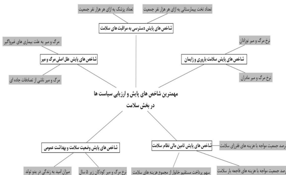
شکل ۲: مهم‌ترین سنجه‌های قابل‌اندازه‌گیری و هدف‌گذاری در بخش سلامت

بین ۲۰ کشوری که بهترین نظام سلامت را در سطح جهان دارند ۱۷ کشور از اتحادیه اروپا هستند. کشورهای اتحادیه اروپا به‌ویژه فرانسه، ایتالیا، اسپانیا و اتریش در مجموع ابعاد نظام سلامت شامل سطح سلامت، عدالت در توزیع سلامت، بار مالی هزینه‌های خدمات سلامت و عملکرد سلامت در جایگاه مطلوبی قرار دارند). ارائه شد.