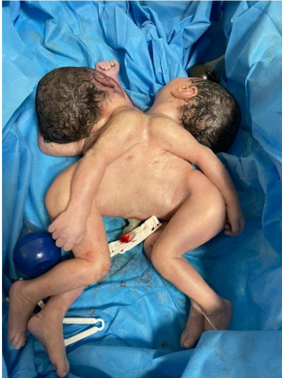
شکل ۲. جنین‌های تورااکواومفالوپاگوس متولد شده

دوقلوهای بهم چسبیده با وجود شایع بودن دیستوشی، امکان پذیر است. زیرا اتصال، اغلب اوقات انعطاف پذیر می باشد. در صورتی که جنین‌ها ترم باشند، ممکن است زایمان واژینال تروماتیک باشد، بنابراین در این موارد بهتر است سزارین انجام شود. میزان مرگ و میر در این دوقلوها بالا بوده و در صورت زنده ماندن نیز طول عمر کوتاهی دارند (۱). در گزارش ما، زایمان به صورت سزارین و اورژانسی انجام شد.