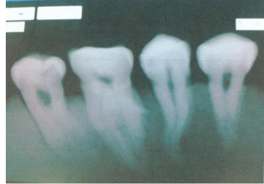
شکل ۱: رادیوگرافی بدون بزرگ‌نمایی

صورت بررسی شدند. در مرحله‌ی اول، رادیوگرافی‌های دیجیتال بر روی کامپیوتر و با نور معمولی مشاهده شدند و در مرحله‌ی بعد، تصاویر دیجیتال را با بزرگ‌نمایی مشاهده کردند (شکل ۱، ۲).