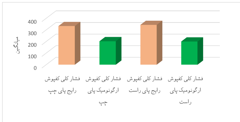
نمودار ۱. مقایسه فشار کلی در پای راست و چپ در دو سطح مختلف