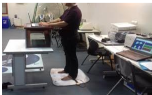
شکل ۱. ارزیابی فشار کف پای بر روی کفپوش ارگونومیک

شرکت کنندگان آموزش داده شد که به صورت عادی بایستند، از محیط تعیین شده خارج نشوند، به میز تکیه ندهند و همچنین برای حمایت وزن بدن با دست به میز تکیه ندهند. در ادامه افراد شرکت کننده شروع به تایپ کردن به عنوان یک وظیفه شغلی سبک شدند و در ۳۰ ثانیه پایانی فشار میانگین نقاط آناتومیکی ذکر شده ثبت شد. البته برای جلوگیری از خستگی افراد و همچنین کاهش خطا در ثبت نتایج فشار کف پا در کفپوش بعدی، شرکت کنندگان به مدت ۳۰ دقیقه استراحت می‌کردند، تمام شرکت کنندگان در طول آزمون پابرهنه بودند. برای تجزیه و تحلیل داده‌های گردآوری شده از نرم‌افزار spss نسخه ۲۰ استفاده شد. روش‌های آماری مورد استفاده در