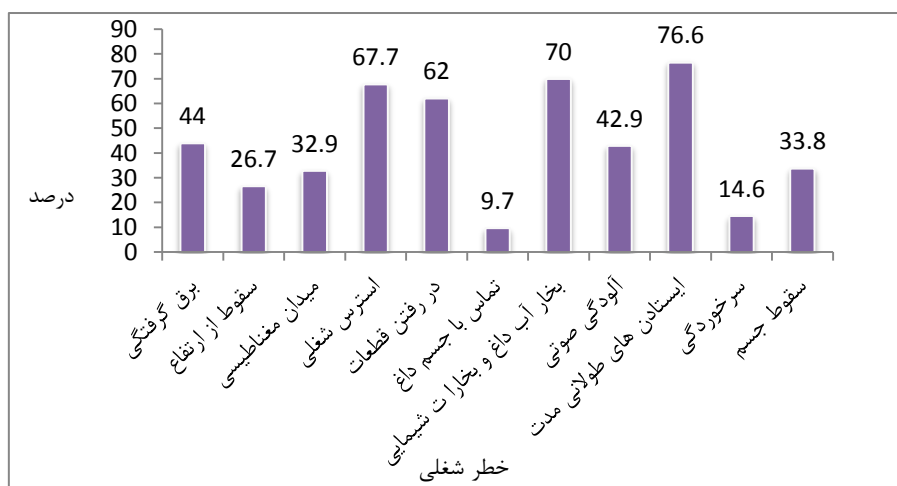
شکل ۲. درصد توزیع فراوانی انواع خطرات شناسایی شده