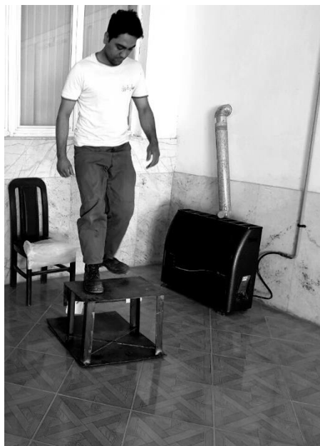
شکل ۱. اجرای تست پله در بین کارکنان شرکت سیمان

Vo 2 max استفاده شد. برای بررسی عوامل پیش‌بینی‌کننده WAI، از رگرسیون خطی چندگانه استفاده شد.