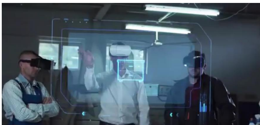
شکل ۳: استفاده از واقعیت مجازی در محیط شغلی