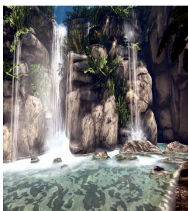
شکل ۲: تماشای آبشار در جنگل

جلسه اول: در این مرحله شرکت‌کنندگان با محتوای بسته آموزش واقعیت مجازی آشنا شدند و نحوه انجام جلسات برای افراد تشریح گردید. جلسه دوم: در این جلسه محیط آرامش‌بخش قرار گرفتند و کاربر توسط عینک واقعیت مجازی در یک محیط مانند تماشای آبشار در جنگل قرار گرفت. جلسه سوم: در این مرحله، فرد ادامه حضور در تماشای آبشار در جنگل را تجربه کرد و به تمرین حضور در یک محیط آرامش‌بخش پرداخت. جلسه چهارم: در جلسه چهارم کاربر در یک جو دوستانه و پرنشاط در محیط شغلی به‌صورت مجازی قرار گرفت. جلسه پنجم: در این مرحله فرد، ادامه حضور در یک جو دوستانه و پرنشاط در محیط شغلی را تجربه کرد و به تمرین حضور در این محیط پرداخت. جلسه ششم: در مرحله ششم فرد در یک مجلس دورهمی و مهمانی شرکت کرد. جلسه هفتم: در مرحله هفتم، کاربر ادامه شرکت در یک مجلس دورهمی و مهمانی را تجربه کرد. جلسه هشتم: در جلسه دوازدهم، نتایج جلسات قبلی بررسی و راهکارها و پیشنهادات مبتنی بر بسته آموزشی واقعیت مجازی ارائه گردید.