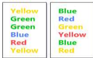
شکل ۱: آزمون استروپ

این کلمات به صورت تصادفی و متوالی نمایش داده می شود که هدف از این مرحله انعطاف پذیری ذهنی، تداخل و بازداری می باشد (۲۰). اعتبار این آزمون بر اساس مطالعات انجام شده ۰/۸۳ گزارش شده است (۲۱). (شکل ۱)