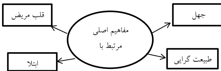
شکل ۲: مفاهیم اصلی مرتبط با ناهنجاری (۴ مضمون اصلی)