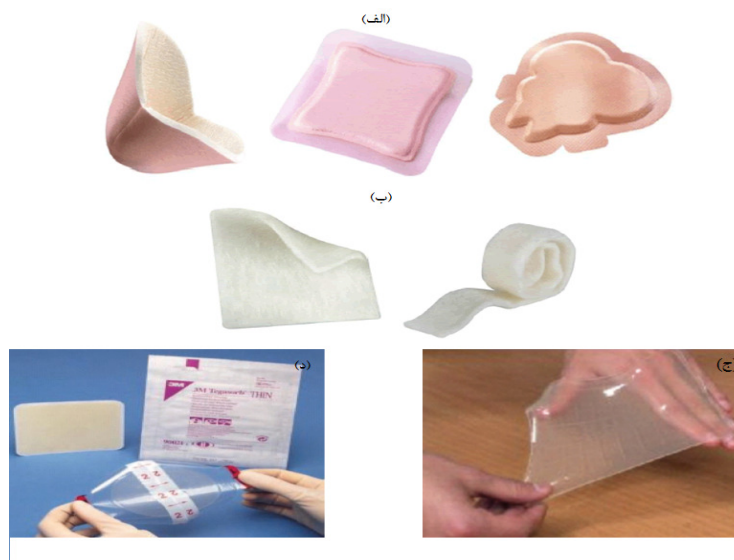
شکل ۳: الف) نمونه‌ای از پانسمان‌های زخم فومی در اندازه و شکل‌های مختلف؛ ب) نمونه‌ای از پانسمان‌های زخم آلژینات؛ ج) نمونه‌ای از پانسمان‌های زخم هیدروژلی؛ د) نمونه‌ای از پانسمان‌های زخم هیدروکلوئیدی (۹۲،۹۳)

ذره یا ورق، موجودند. آن‌ها ترشحات زخم را جذب می‌کنند تا یک ژل نرم زیست تخریب پذیر روی سطح زخم ایجاد شده و موجب حفظ رطوبت زخم شود (۸۴). اسید هیالورونیک (HA) یک جزء گلیکوآمینوگلیکان ماتریکس خارج سلولی (ECM) با ویژگی‌های بیولوژیکی و فیزیکی منحصربه‌فرد است. همانند کلاژن، HA نیز به‌طور طبیعی زیست سازگار، زیست تخریب پذیر و دارای قابلیت ایمنی‌زایی است (۸۵). کیتوسان نیز یکی از پلیمرهای زیست فعال است که باعث تسریع تشکیل بافت گرانوله در مرحله تکثیر از فرآیند بهبود زخم می‌شود (۸۶). خواص کیتوسان، اجازه اتصال آن به گلیبول‌های قرمز را داده و باعث لخته شدن و بند آمدن سریع خون می‌شود. همچنین این ماده در آمریکا برای استفاده در بانداژها و دیگر عوامل بند آورنده خون تأیید شده است (۸۷،۸۸). علاوه بر آن،