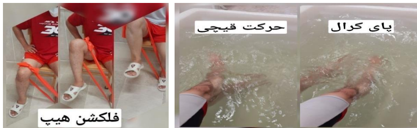
شکل ۲: نمونه‌ای از تمرینات گروه تمرین با تراباند و تمرین در آب