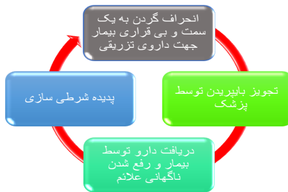
نمودار ۱: شرطی سازی و تقویت مثبت دریافت دارو

سدیم والپروات (۵۰۰ میلی‌گرم هر ۱۲ ساعت)، لیتیم کربنات (۳۰۰ میلی‌گرم هر ۱۲ ساعت)، تیوریدازین (۲۵ میلی‌گرم هر شب) و مدروکسی پروژسترون استات ۵ میلی‌گرم (روزی