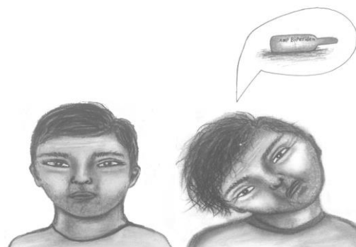
شکل ۱. انحراف عمدی گردن باهدف دریافت داروی تزریقی بایپریدن در اثر شرطی شدن به منظور بالابردن خلق و خو

نیست، بنابراین نمی‌تواند از نوع دیستونی عملکردی باشد. اختلال ساختگی یک اختلال روانپزشکی است که در آن افراد مبتلا به عمد علائم جسمی یا روانی را برای به عهده گرفتن نقش یک بیمار جعل می‌کنند. بدون هیچ سود آشکار بیماران مبتلا به اختلال ساختگی اغلب در بیمارستان بستری می‌شوند و تحت درمان قرار می‌گیرند. بیماران به‌طور فریبنده‌ای علائم بیماری و یا آسیب‌ها را روی خود، حتی در نبود مزایای بیرونی آشکار مانند سود مالی، خانه یا دریافت دارو، شبیه‌سازی و ایجاد می‌کنند (۱۴، ۱۵). اما به دلیل همپوشانی موارد فوق و تغییر علائم بیمار در طی زمان، به‌کارگیری آن‌ها دشوار است. تایید اینکه هدف بیمار از وانمود کردن بیماری دسترسی به دارو می‌باشد، مسئله مهمی جهت تمایز اختلال ساختگی از تمارض