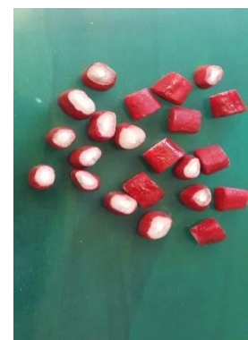
شکل ۱: بلوک‌های عاجی بعد از زدن دو لایه لاک