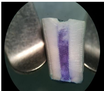
شکل ۲: بررسی نشست رنگ در نمونه‌های گروه ۱ با استریومیکروسکوپ با بزرگنمایی ۱۵×

برای بررسی سختی از تست میکروهاردنس با دستگاه ویکرز استفاده شد. میانگین سختی در گروه ۱، ۵۴/۲۲ و در گروه ۲، ۴۱/۲۰ گزارش شد. میزان اختلاف سختی دو گروه از نظر آماری معنادار بود ( P < 0/001 ). حداکثر و حداقل میزان سختی در گروه ۱ به ترتیب، ۷۳/۲۰ و ۳۱/۲ و در گروه ۲ به ترتیب، ۵۵/۵۰ و ۲۹/۸ بود (جدول ۱). برای بررسی میزان ریز نشست از روش نفوذ رنگ استفاده شد. میزان نفوذ رنگ بر حسب میلی متر در گروه‌های مختلف ثبت و با یکدیگر مقایسه گردید. نتایج حاصل از تجزیه و تحلیل اطلاعات به دست آمده از این پژوهش نشان می‌دهند که میانگین نمره ریز نشست پس از سه روز در گروه ۱، ۰/۹۷۳۹ میلی متر و در گروه ۲، ۰/۱۳۹۱ میلی متر بود. حداقل میزان نشست رنگ در گروه ۱ و ۲، صفر و حداکثر میزان نشست رنگ در گروه ۱، ۵ میلی متر و در گروه ۲، ۱/۸ میلی متر بود. اختلاف آماری معناداری بین میانگین میزان نفوذ رنگ بعد از ۳ روز در دو گروه دیده شد ( P < 0/05 ). (جدول ۲). در گروه کنترل مثبت رنگ به طور کامل در طول بلوک‌های عاجی نفوذ کرده بود و در گروه کنترل منفی هیچ نفوذ رنگی در بلوک‌ها دیده نشد، که نشانگر صحت روش انجام مطالعه می‌باشد.