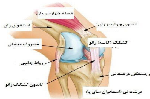
شکل ۲: مفصل زانو

چهارسر ران بسیار مهم است، زیرا این عضلات تثبیت‌کننده اصلی کاسه زانو هستند (۵۹). نتایج حاصل از تحقیقات نشان داد که تمرینات PNF، به تقویت و کشش عضلات چهارسر ران و عضلات جلوی ران کمک می‌کند (۶۰). از محدودیت تحقیق