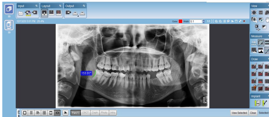
شکل ۱: اندازه‌گیری زاویه بین تاج و ریشه دندان مولر سوم سمت راست مندیبل در رادیوگرافی پانورامیک با استفاده از نرم‌افزار Romexis Viewer. (خطوط رسم شده با رنگ سبز در دیستال دندان مولر سوم مشهود است)