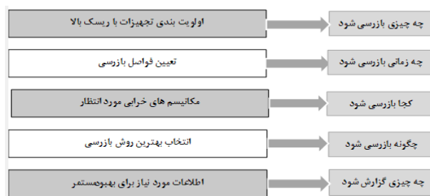
شکل ۱: نتایج ارزیابی RBI برای برنامه‌های بازرسی

RIMAP) را تایید کرد (۲۸). روش بازرسی بر مبنای ریسک برای سیستم‌های تحت فشار شامل: لوله‌ها، مبدل‌های حرارتی، مخازن ذخیره، مخازن تحت فشار و فیلترها قابل اجرا می‌باشد و به‌منظور انجام آنالیز RBI برای هر مورد، ریسک خرابی پس از تعیین احتمال وقوع خرابی و پیامد وقوع خرابی به صورت جداگانه و از ترکیب این دو فاکتور محاسبه می‌شود (۲۹). تکنیک بازرسی مبتنی بر ریسک، از روش‌های رسمی تعیین ریسک برای تصمیم‌گیری در خصوص برنامه‌های بازرسی استفاده می‌کند (۳۰). شکل ۱ نتایج ارزیابی RBI برای برنامه‌های بازرسی را نشان می‌دهد (۲۹).