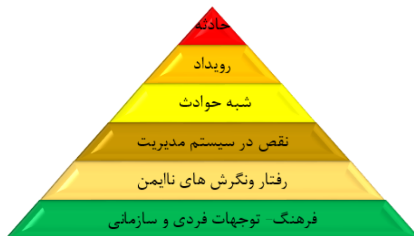
شکل ۱: ارتباط فرهنگ، سیستم مدیریتی و حوادث در سازمان

رفتارهای نایمن و فرهنگ مقصر یابی میباشد [13] ارتباط بین حوادث و رویدادها و سیستم مدیریت ایمنی و درک و نگرش و آگاهی در بین افراد یک سازمان و فرهنگ ایمنی در سازمان به