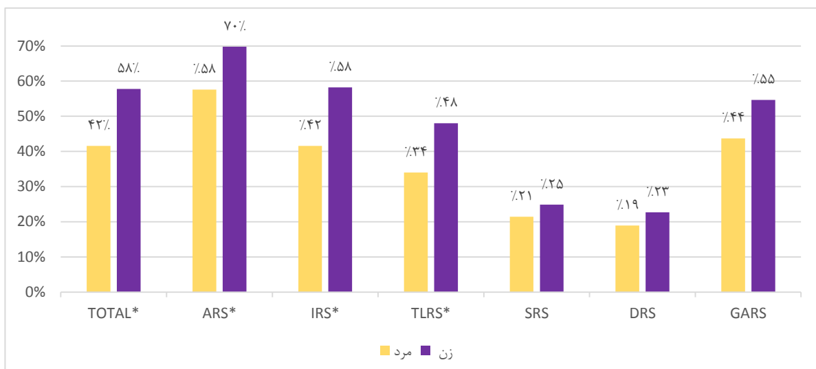
نمودار ۲: مقایسه توزیع فراوانی استرس شدید/زیاد بین دو جنس مرد و زن در کل و ابعاد مختلف (*اختلاف معنی‌داری بین دو گروه)

تفاوت در بعد روابط بین و درون‌فردی و اجتماعی در این گروه تفاوت معنی‌دار آماری نیز داشت (نمودار ۳).