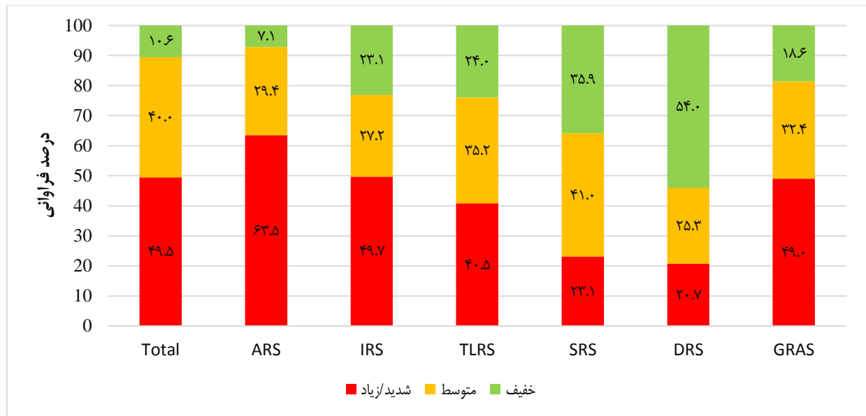
نمودار ۱: توزیع درصد فراوانی شدت کلی استرس و نیز به تفکیک ابعاد مختلف

تمامی ابعاد مورد مطالعه نسبت به آقایان میزان شدت استرس بیشتری را تجربه کرده بودند و این مهم حاکی از آن است که این گروه نیاز به توجه و حمایت‌های بیشتری نسبت به کل دانشجویان دارند (نمودار ۲).