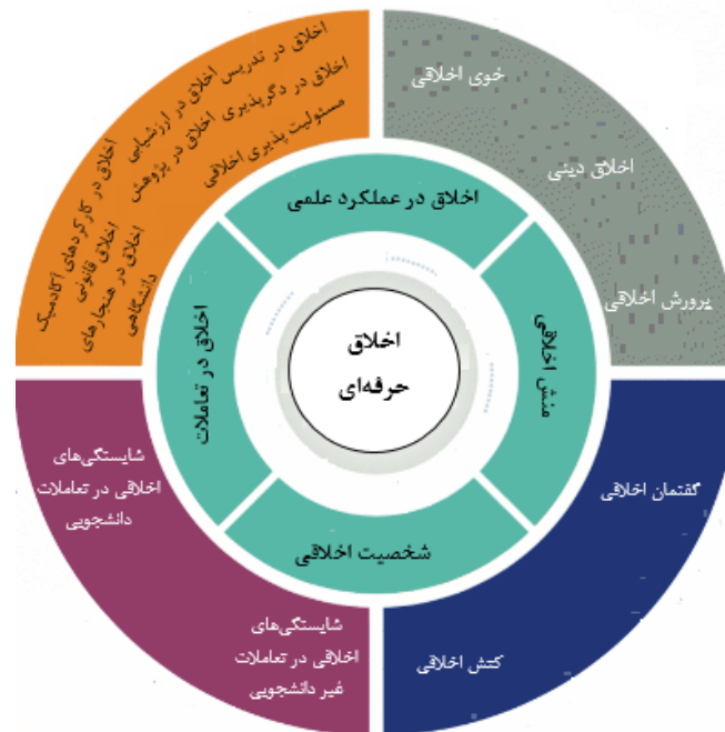
تصویر ۳. مدل مفهومی پژوهش برآمده از یافته‌ها

از مولفه‌های چهارگانه اخلاقی (اخلاق در عملکرد علمی، اخلاق در تعاملات، شخصیت اخلاقی، منش اخلاقی) بر اساس مطالعات انجام شده می‌باشد.