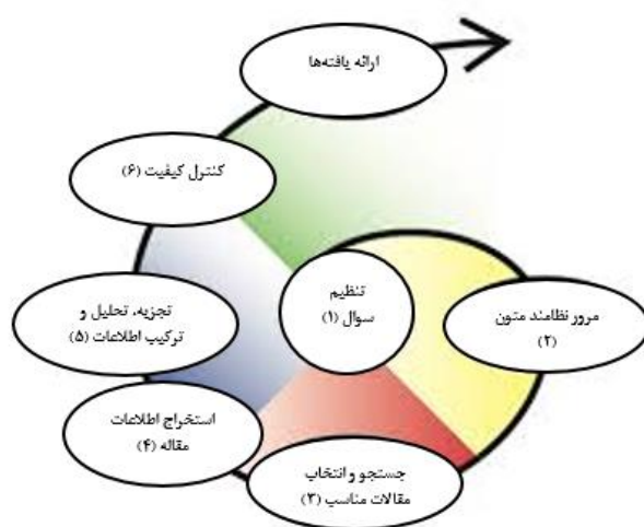
تصویر ۱: هفت مرحله روش فرا ترکیب سندلوسکی و باروسو

کلیدواژه‌های: اخلاق تدریس، اخلاق حرفه‌ای در آموزش عالی، تدریس، استاد، معلم در کلیه پایگاه‌های اطلاعاتی فارسی زبان؛ Noormag؛ SID؛ Magiran؛ Ensani؛ جستجو به عمل