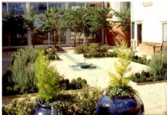
تصویر شماره ۴ - استفاده از الگوی باغ ایرانی در طرح محوطه‌ی درمانی مؤسسه‌ی مراقبت از سالمندان در انگلستان