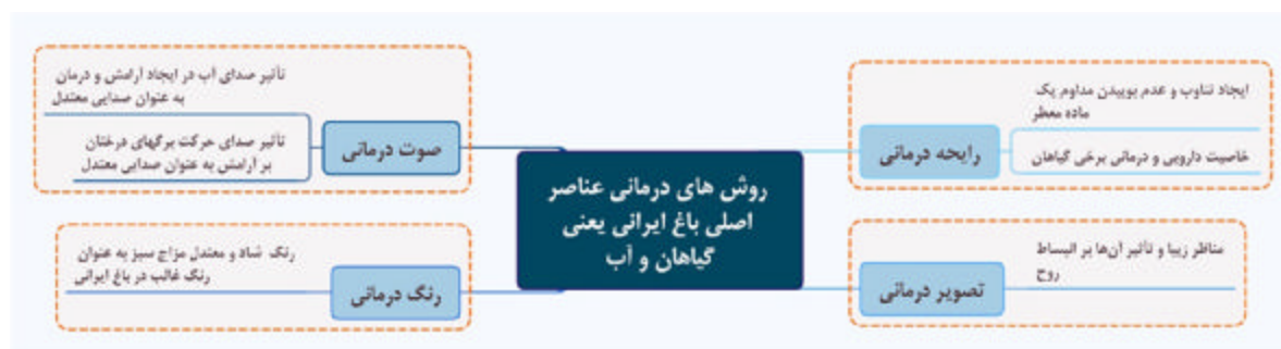
شکل شماره‌ی ۱- تأثیر عناصر نشا‌آور در باغ ایرانی بر سلامتی و درمان، بر اساس طب سنتی ایران

بهرتر بین محیط و انسان باشد؛ زیرا سبب آرامش و بهبود وضعیت جسمی و روحی و روانی می‌شود؛ در نتیجه می‌توان گفت، باغ ایرانی به دلیل کاربرد مؤثر در حفظ سلامتی و شفای بیماری‌های جسمی و خصوصاً روحی و روانی، فقط کارکرد